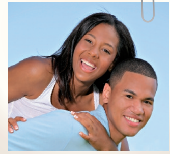
On a choisi la SMERAG